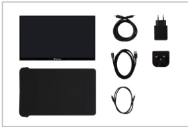
Contenuto della confezione