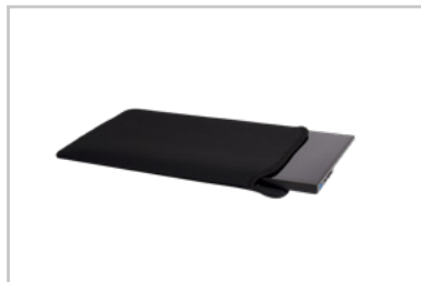
Busta protettiva in neoprene