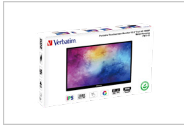
Confezione in 3D