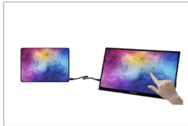
Monitor con tablet