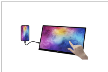
Monitor con smartphone