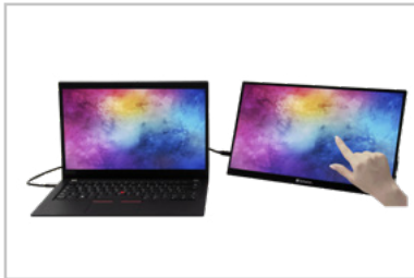
Monitor con laptop